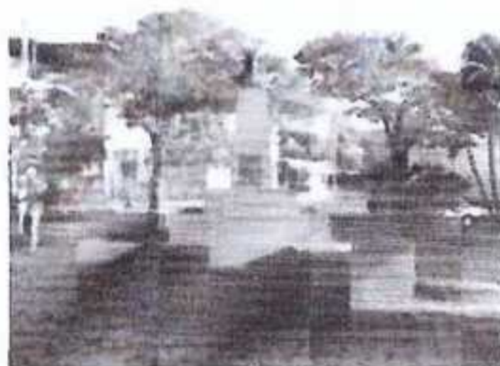
Figura 1 Imagem de referência da praça