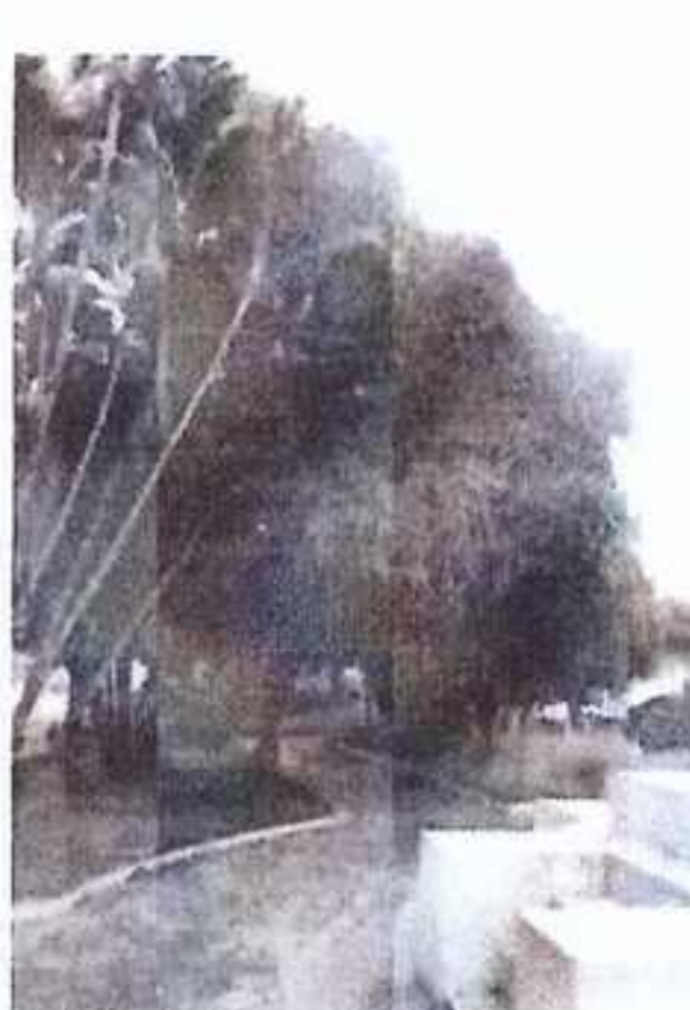
Imagens atuais da Praça Getúlio Vargas evidenciando espécies arbóreas inadequadas, do ponto de vista da preservação do Patrimônio Paisagístico: Goiabeira, Mangueira e Jambuí